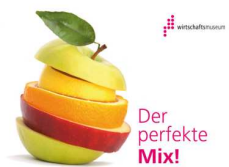
Österreichisches Gesellschafts- und Wirtschaftsmuseum, 1050 Wien