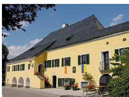
Auer von Welsbach–Forschungsinstitut, Althofen