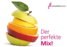
Österreichisches Gesellschafts- und Wirtschaftsmuseum, 1050 Wien