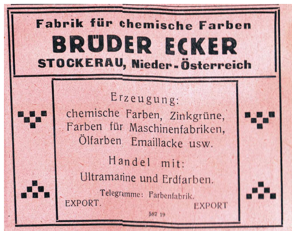
Diese Werbe-Einschaltung – ganz im Jugendstil gehalten – wurde dem Industrie-Compass 1919 Bd I S entnommen (Österreichische Nationalbibliothek)

Als Folge des ersten Weltkriegs fielen nach 1918 etliche wichtige Abnehmer aus, es mussten große Anstrengungen unternommen werden, um das Unternehmen zu erhalten.