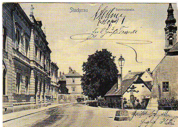
Diese Correspondenz-Karte trägt als Aufgabedatum den 7.6.1908 und zeigt die Bahnhofstraße Richtung „zum Scharfen Eck“ Das einstöckige Haus links zeigt das damalige Firmenobjekt Bahnhofstrasse 6-8