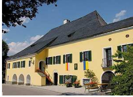
Auer von Welsbach–Forschungsinstitut, Althofen