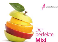
Österreichisches Gesellschafts- und Wirtschaftsmuseum, 1050 Wien