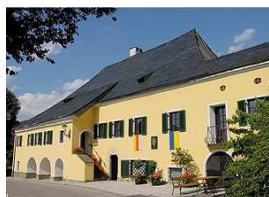
Auer von Welsbach–Forschungsinstitut, Althofen