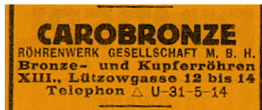
Amtliches Teilnehmerverzeichnis Fernsprechnet Wien 1933 Branchenteil S 395

„Caro“ wird als eingetragenes Warenzeichen registriert