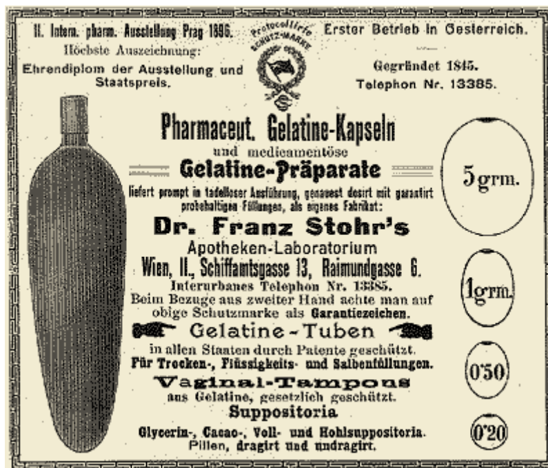
Werbung anno 1893, ZAV aus ÖAZ Aktuell (Ausgabe 25/2001)

diesem Gebiet bahnbrechend gewirkt [...] zu haben." ( Dr. Stohr, Gründungsversammlung, 12. Mai 1916 )