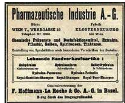
Die älteste Wurzel der Herba Chemosan: Raabe & Röder