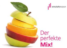
Österreichisches Gesellschafts- und Wirtschaftsmuseum, 1050 Wien