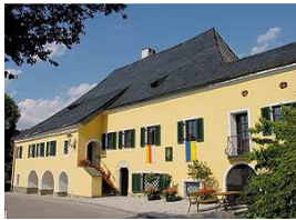
Auer von Welsbach–Forschungsinstitut, Althofen