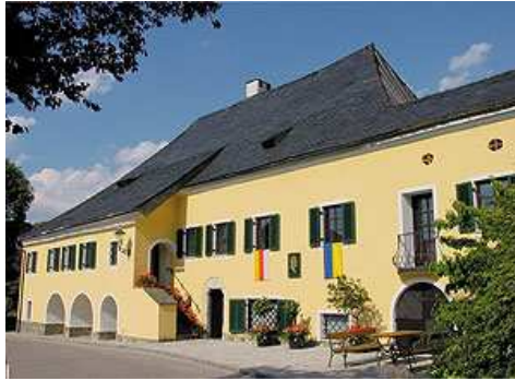
Auer von Welsbach–Forschungsinstitut, Althofen