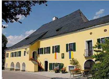
Auer von Welsbach – Museum, Althofen