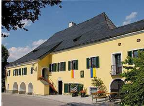
Auer von Welsbach–Forschungsinstitut, Althofen