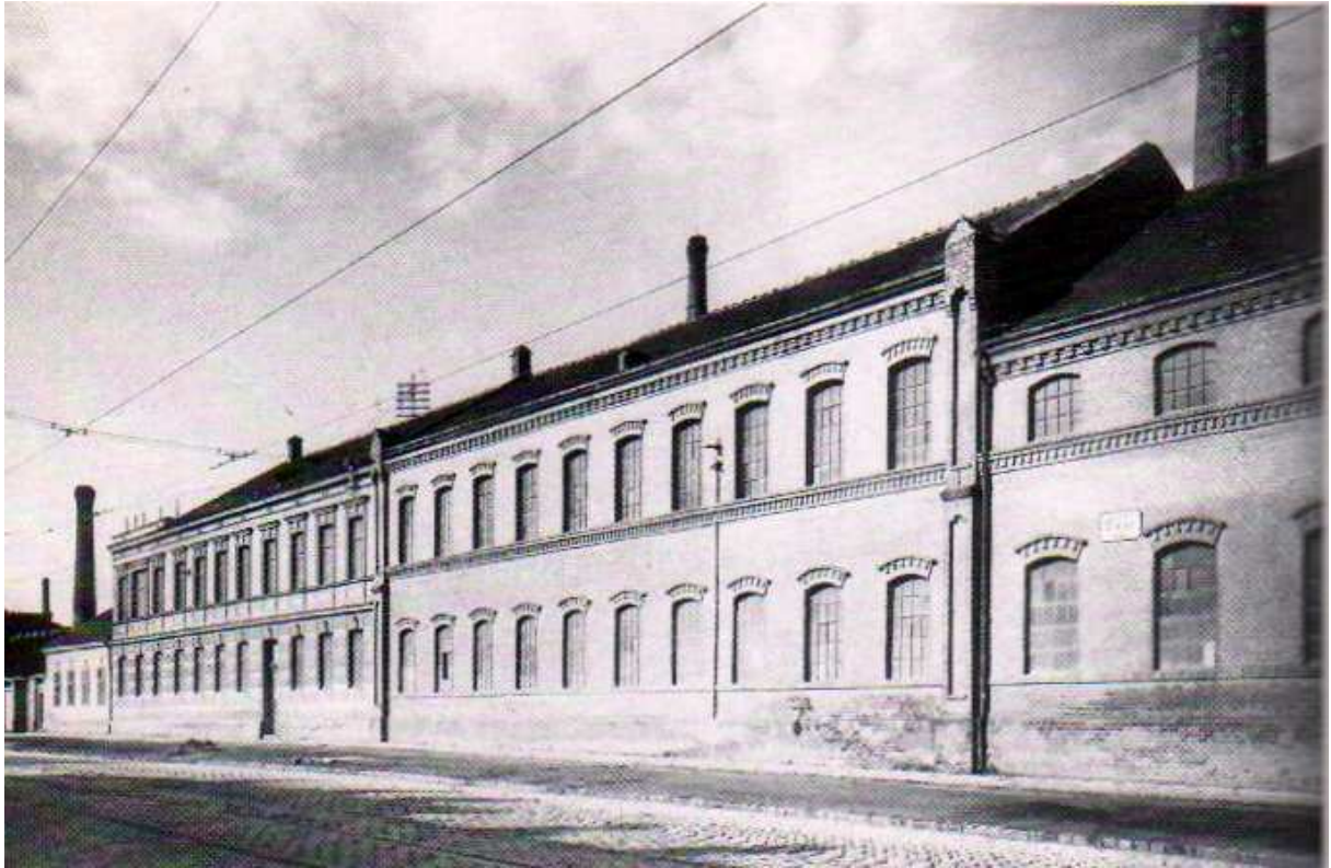
Linzer Straße 150 – 158 – Foto aus 1930