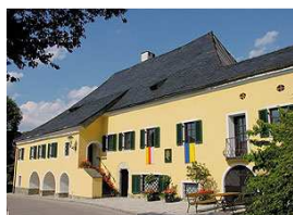
Auer von Welsbach-Forschungsinstitut, Althofen