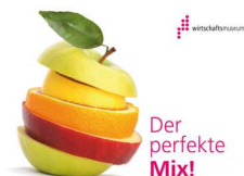
Österreichisches Gesellschafts- und Wirtschaftsmuseum, 1050 Wien