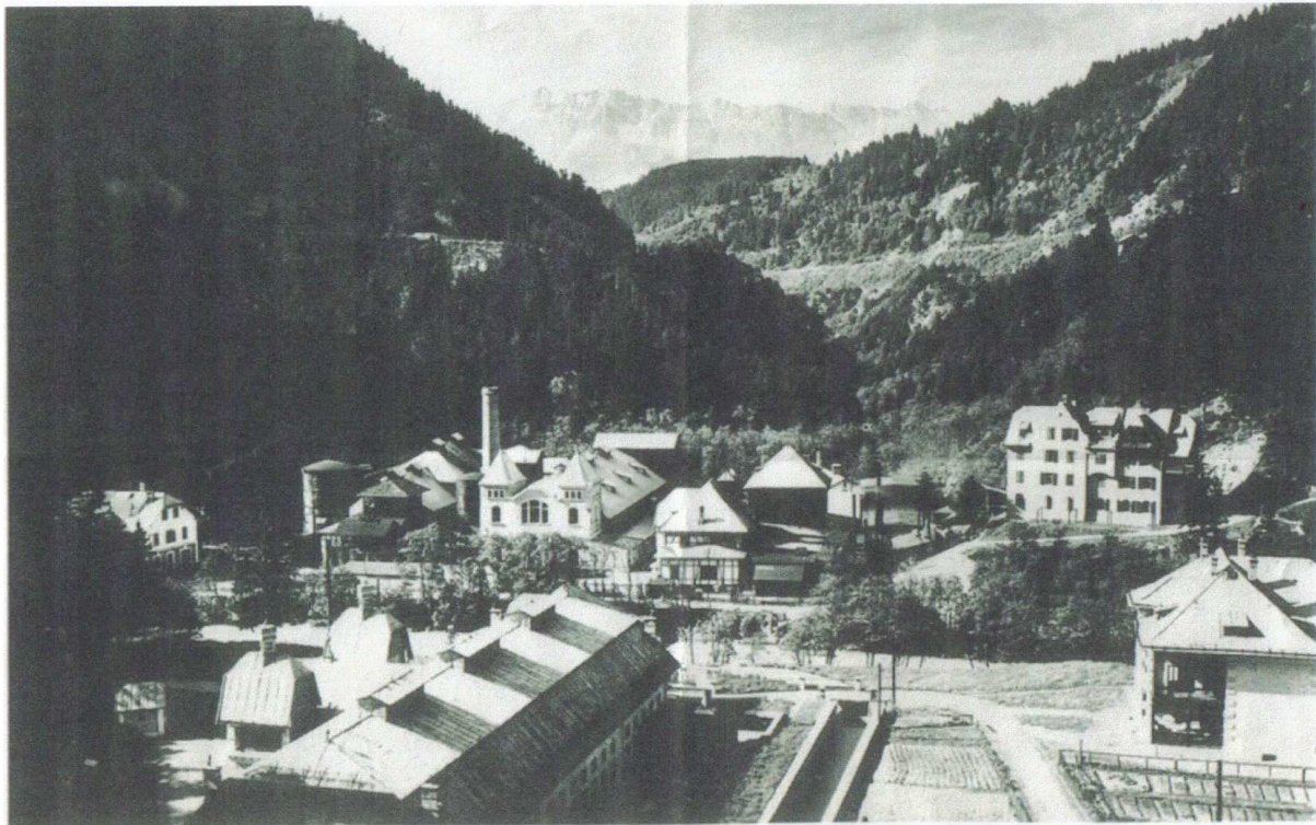
84 Gesamtansicht der Sillwerke.