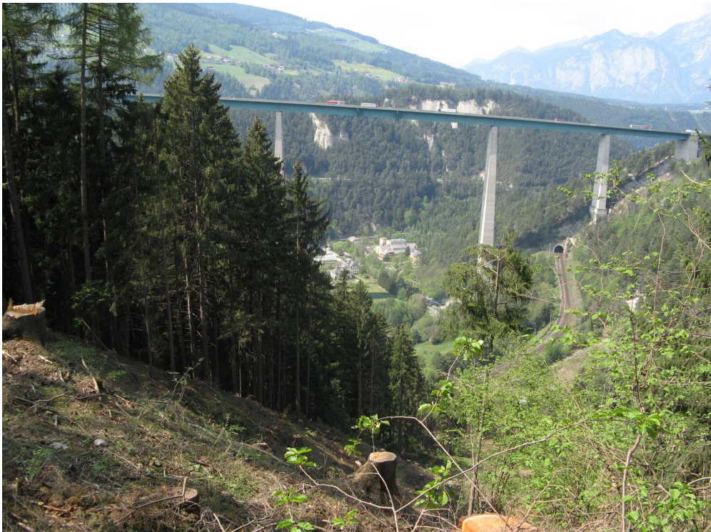
Bildmitte ehemaliges Planseewerk, gegenüber, etwas verdeckt, das E-Werk Rechts im Bild die Brennerbahn Brennerautobahn