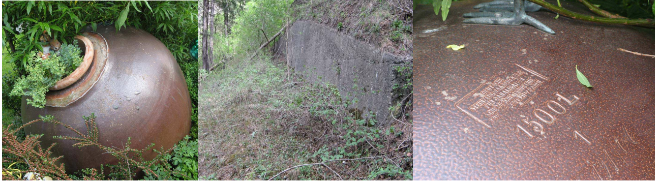
Säurebehälter und Bahntrasse zur Brennerbahn