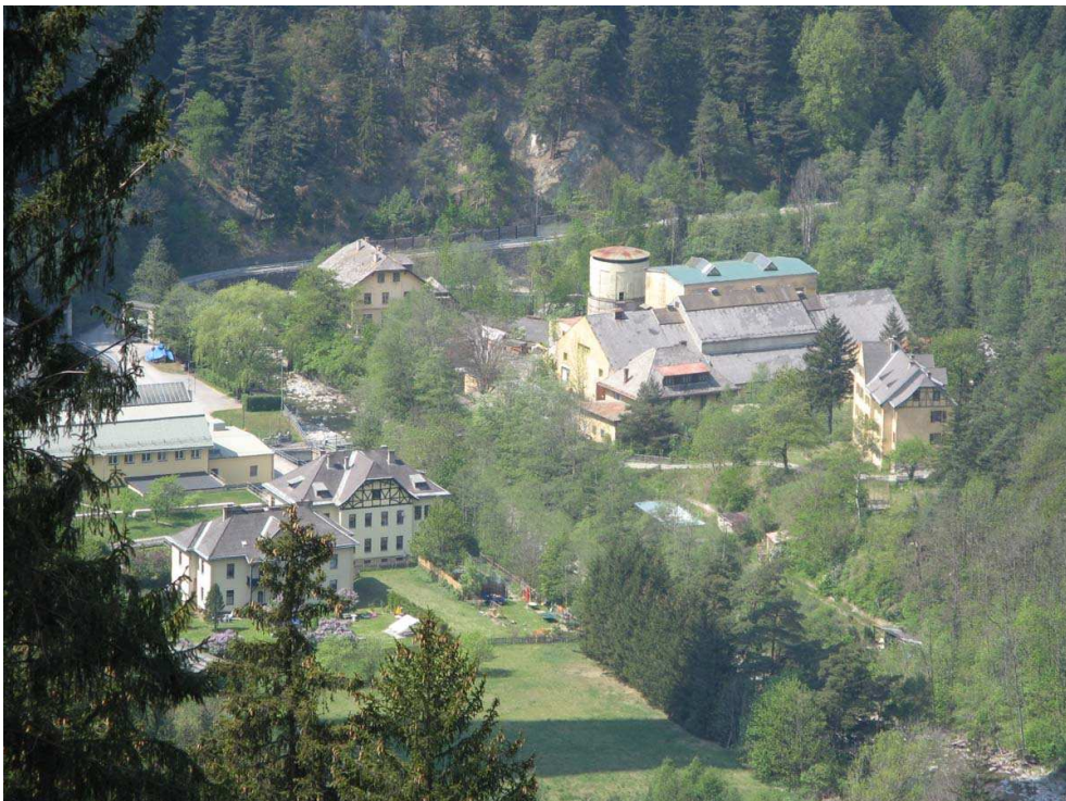
Sillwerk: Bildmitte: Sill, rechts: Planseewerk (Ehemaliges Salpeterwerk), links E-Werk, Arbeiterwohnhäuser

Die Ausbeute betrug 60 g HNO 3 pro Kilowattstunde. Das entsprach einer Produktionsmenge von 2,4 kg HNO 3 pro Ofen und Stunde. Salpetersäure ist einer der wichtigsten Grundstoffe der Chemie mit vielfältigen Anwendungen.