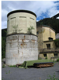
Sillwerke – alte Produktion