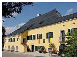
Auer von Welsbach–Forschungsinstitut, Althofen