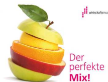
Österreichisches Gesellschafts- und Wirtschaftsmuseum, 1050 Wien