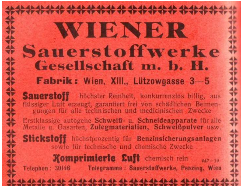
Werbung Industrie Compass 1919 s 1257