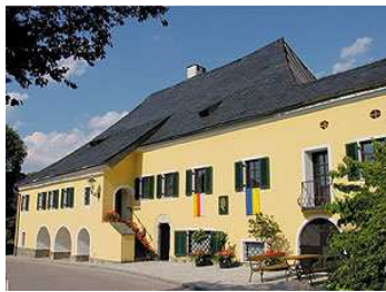
Auer von Welsbach-Forschungsinstitut, Althofen